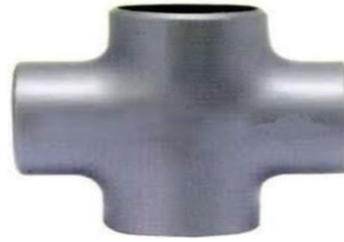
3/4" INEGAL KRUYA