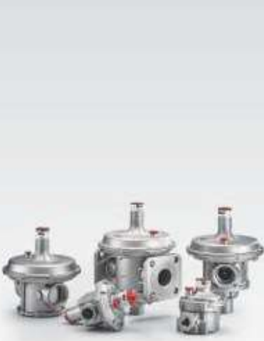
TEK KADEMELİ GAZ BASINÇ REGÜLATÖRLERİ