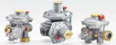
ÇİFT KADEMELİ SERVİS REGÜLATÖRLERİ