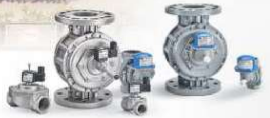
GAZ VALFİ VE DEPREM VANALARI