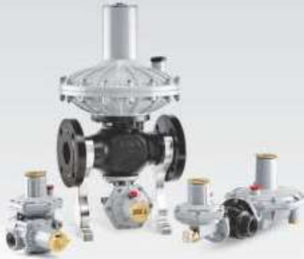
DİREKT ETKİLİ GAZ BASINÇ REGÜLATÖRLERİ